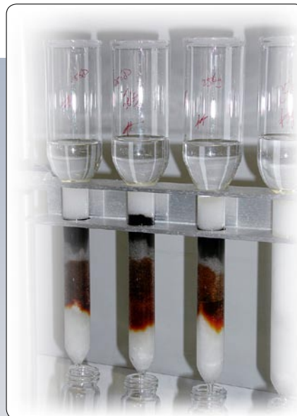
Abb. 2 Hochdurchsatz-Extraktion von PCBs/Dioxinen aus Futter- und Lebensmitteln