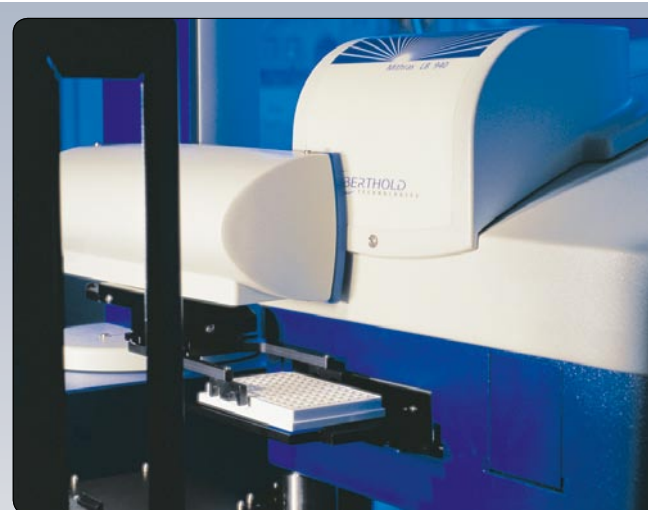
Abb. 5 Hochdurchsatz-Messung des Dioxin und separat des PCB-TEQs mittels (Multi Mode-) Luminometer Messgerät mit Autosampler Aufsatz