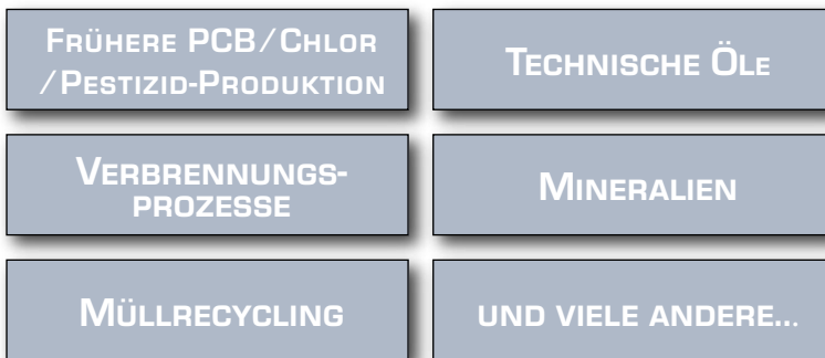
Abb. 5: Typische Quellen für erhöhte Dioxin- und PCB-Gehalte in der Futter- und Lebensmittelkette