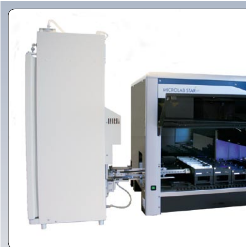
Abb. 3 Hochdurchsatz-Trennung von PCBs und PCDD/Fs in 2 Fraktionen