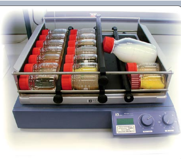
Abb.1: Hochdurchsatz zell-basierte Dioxin/PCB Analytik mittels Roboter

Nach der Dioxin-Krise im Jahr 1998 reagierte die EU mit dem Erlass zweier Richt-