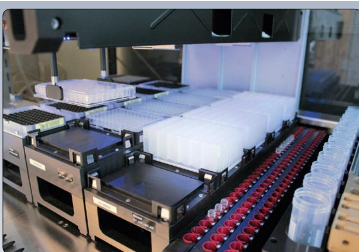
Abb. 4 Hochdurchsatz – Zellen aussäen und Standards/Proben Dosierung mittels Roboter